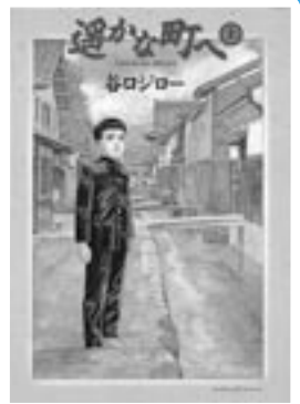
◎谷ロジロー「選かな町へ」小学館