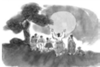
▲満月に代表される韓国の名節「正月テポルム」