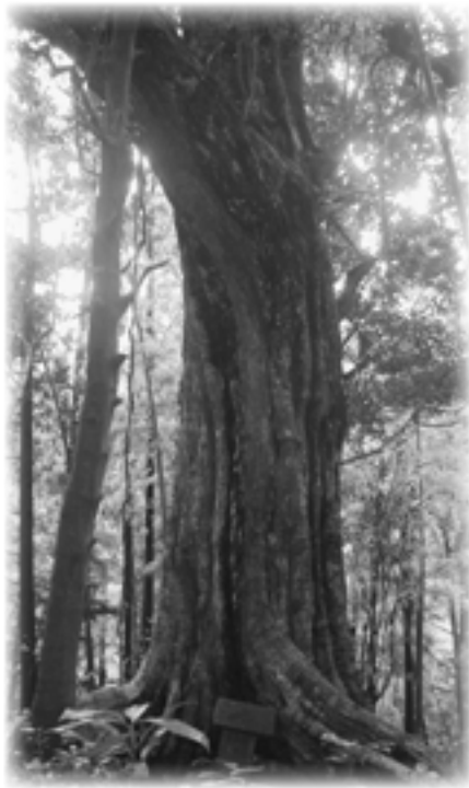
赤岩観音堂のシイ (関金町明高)

倉吉市保存樹 指定番号 115 (平成18年2月20日指定) 樹種…ツブラジイ 樹高…25m 幹の周囲…6.0m 樹齢…500年 ・山地系であるツブラジイはスタジイに比べ、倉吉市内にはめずらしい存在です。 ・本種は樹皮が滑らかで、樹冠が傘状によくまとまっており果実は、まるく小さいのでコジイの別名もあります。 ・本樹は、明高赤岩観音堂の境内にあり、根元には祠があつて靈気で満ちています。