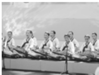
「カヤグム」を弾く「羅州小学校」の子どもたち (7月28日 倉吉未来中心)

そして、ドラマの人気とともに、主人公が着た華やかな韓服(ハンボック)と、彼女の得意な「コムンゴ」「カヤグム」などの伝統楽器も再評価され、韓国の伝統美の再発見にも寄与しました。