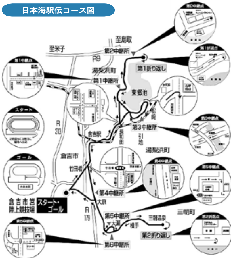
日本海駅伝コース図