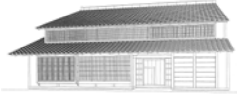
旧牧田家住宅主屋復元図

は最も古い宝暦10年(1760)の建築です。構造の小屋根組みの特徴が古い草葺屋根と共通するところが、柱・梁・垂木材などの木割が極めて太く、素朴で豪壮な内部空間を作りだしています。