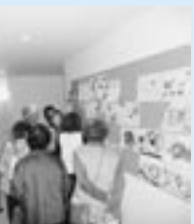
▲学生の作品を鑑賞しました

められ る授業 や、音 楽やリ ズムに 合わせ て体全 体を使 いなが らいき いきと した表 情で授 業を受 ける学 生たち の様 子など いくつ かの授 業を見 学しま した。昼 食を学 生食堂 で取っ た後、 併美術 館と併 研究