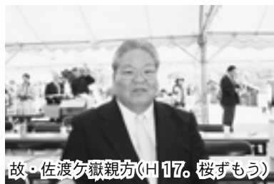
故・佐渡ヶ嶽親方(117歳、桜ずもう)