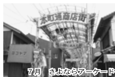
7月 さよならアーケード