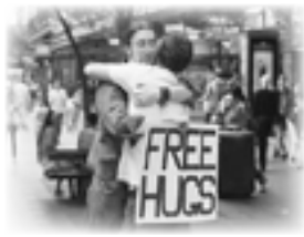
▲フリーハグを実践しているオーストラリアの青年

寒い冬、恋人もいないし、他人とのハグにも抵抗感がある人は、身近な家族や友達を一回ギュッと抱きしめてみるのはいかがですか。次は、市報2月号でお会いしましょう。では、心温まる新年をお迎えください。