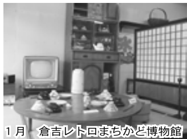
1月 倉吉レトロまちかど博物館