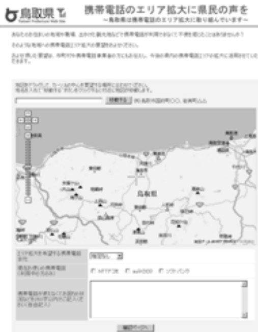
鳥取県ホームページの要望受付サイト

0857-268107 / E-mail: jyouhou@pref.tottori.jp