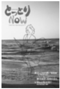
▲とっとりNOW 第77号表紙

巻頭特集では、若桜町、湯 梨浜町など県内の蔵元を訪 ね、銘酒が生まれた水や米な どの背景に迫りつつ、酒に合 う肴、鉄道、まちなみなどを