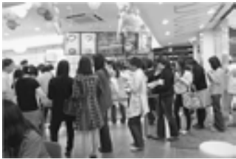
▲昨年4月、韓国に上陸した「ミスタードーナツ」明洞店

「人間関係」においても、経済市場においても「信頼」に勝るものはないというところです!!