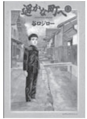
◎ 谷口ジロー『選かな町へ』小学館

「スポ・レク鳥取2006」 倉吉市は年齢別バドミントンと壮年ポウリング 今年10月21日から24日までの4日間、鳥取県でスポーツ・レクリエーション祭(以下「スポレク祭」と呼びます)が開催されます。 スポレク祭は、国内外から集う参加者と県民の交流で、鳥取県の魅力にあふれ、感動をわかちあえる祭典で、いつでも、どこでも、だれでも、いつまでも気軽に楽しめるスポーツ・レクリエーションの輪を広げ、地域に根ざした生涯スポーツの振興を図ることを目的とした大会です。 県内13市町村で計25種目の大会が行われます。 倉吉市は、倉吉体育文化会館で年齢別(30歳以上)バドミントン、倉吉プラザポウルで壮年(50歳以上)ポウリング大会が開催されます。 また、21日は、倉吉未来中心で開会式が開催されます。(鳥取市、米子市、倉吉市の県下3地区で同時開催)