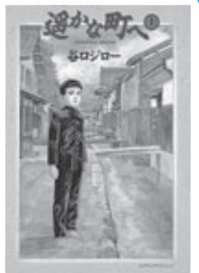
◎ 谷口ジロー『遙かな町へ』小学館