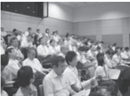
▲「若者の定住化を考えるシンポジウム」(平成18年8月8日)