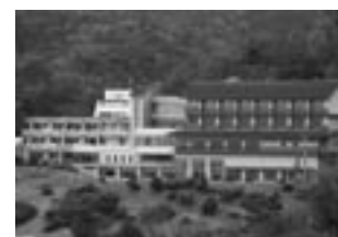
グリーンスコールせきがね