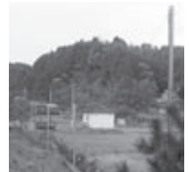
一般コミュニティ助成事業で整備した有線放送設備(谷自治公)