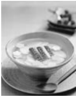
韓国のお雑煮「トック」

ソルナルの朝は、前日作った料理でチャレを行います。チャレが終わると、家族が集まり、その料理と「トック」(白くて長いお餅を切った作ったスープ)を食べます。これには新年を迎え、心清らかに、そして長生きできるようにとの願いが込められています。よく年の数だけ食べるものだと言われる「トック」。今年、お腹いっぱい食べられるのはいいですが、何かが悲しくなりますね！