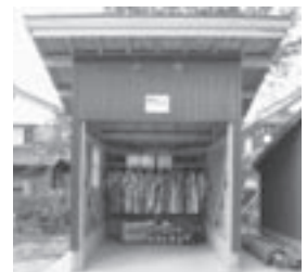
自主防災組織育成助成事業で整備した消防格納庫資機材(上古川自治公)