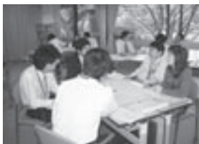
若者定住化促進検討 プロジェクト