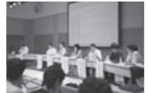
若者の定住を考える シンポジウム(18.8.8)