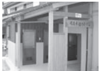
一般コミュニティ助成事業で整備した若土水辺のトイレ(若土自治公)