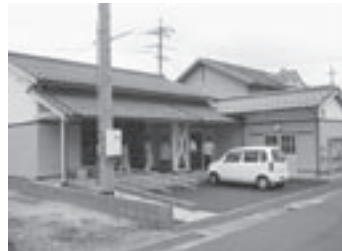
コミュニティセンター助成事業で整備した下余戸自治公民館(下余戸自治公)