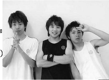
うたう動物園の皆さん