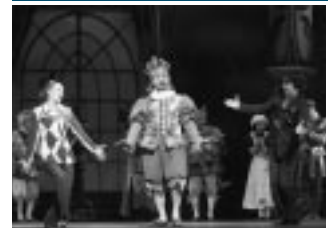
前回公演より