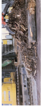
リサイクルセンター

とや、少しだけ農業経験があったことも影響した理由です。入社2年目の現在は、トマトの赤計な株を捌いたり、誘引したりすることが主な仕事です。トマトはどんどん成長して苗所で作業になるので、作業中は高所作業用の足車に乗ったまま移動します。専門用語がわからない