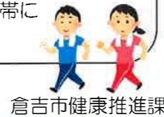
倉吉市健康推進課

歩く時間は連続じゃなくてもOK! 朝15分夕方15分と分けて歩くのと連続30分歩くのと効果は変わらないそうです。1日の時間のある時にムリなく好きな時間帯にウォーキングしてみましょ♪