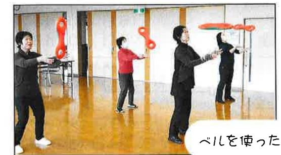
ベルを使った体操