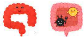
倉吉市健康推進課

※新型コロナウイルス感染防止のため、一人ひとりが①身体的距離の確保②マスクの着用③手洗いや、「3密(密集、密接、密閉)」を避けるよう心がけましょう。