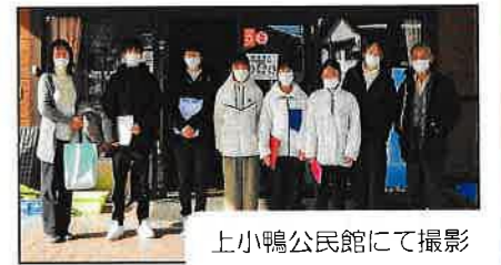
上古川公民館にて撮影

昨年12月21日(月)、22日(火)の2日間に亘り、実習生6名、引率教員1名の計7名の方が、上古川地区に於いて研修を実施されました。地域の概要(歴史、特徴)、地域での取組み、行事等について説明を行い「地区踏査」で現場をつぶさに見て頂き更に理解を深めて頂きました。