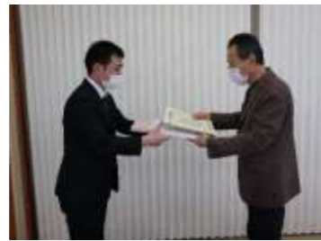
1月26日小鴨公民館にて