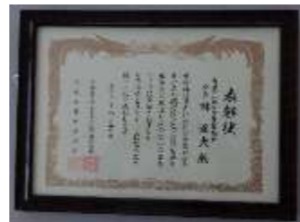
防犯活動を組織的に推進しているとして表彰されました