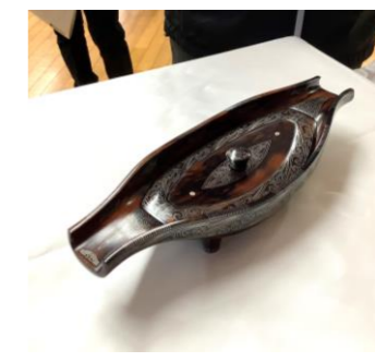
黒柿蘇芳染拭漆岡文雲文嵌荘香盒子 「天神」