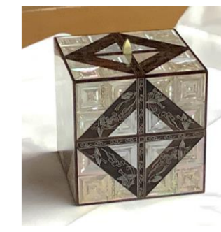
黒柿蘇芳染雲鳥文嵌荘螺鈿香方容 「須彌ノ園」