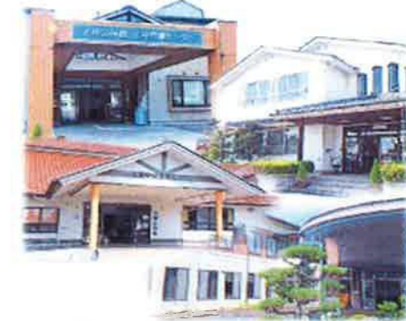
(8月25日 日本海新聞記事より)