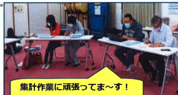
集計作業に頑張ってます！