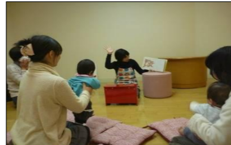
活動の様子「おはなしかい」「音読教室」 現在は参加者の距離をあけて実施しています。

また、図書館で発行している広報誌「図書館ニュース」を読み上げた音訳図書ニュースの発行を行っています。他にも、農業支援、ビジネス支援、英語教育支援等それぞれの課題にあった資料を充実させ、課題解決につながる情報を提供しています。今後も、みなさんの「知る」ことのお役に立てるよう、共に考え、多くの方たちのご協力をいただきながら、図書館のサービスを行ってまいります。困ったことはどんなことでもお尋ねいただき、図書館をご活用ください。成徳地区のみなさんのご来館をお待ちしております。