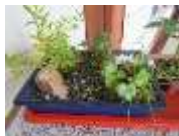
明倫公民館に見本があります。