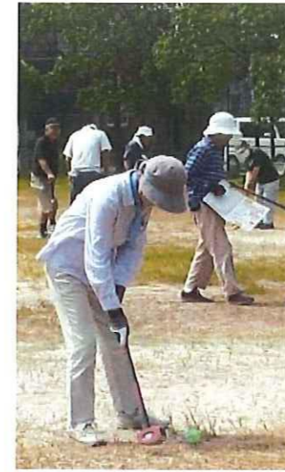
本町が優勝 グランドゴルフ