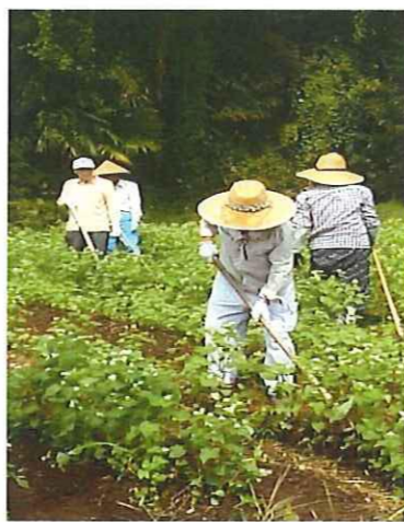
畝間を鍬で土をならす。