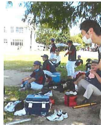
木陰で出番を待つ選手

9月6日（日）午前9時から、「地区球技大会」が河北小学校・河北中央公園で開催されました。台風10号の影響か、34～35℃の暑さ。“密”を避けるために、ソフトバレーは今年行われませんでした。コロナと熱中症対策をしながらの運営になりました。この大会は、相次いで中止になっていた自治公民館協議会主催のイベントの、久し振りの行事となりました。なお、今年は例年より参加チームは減少していましたが、良い交流となりました。