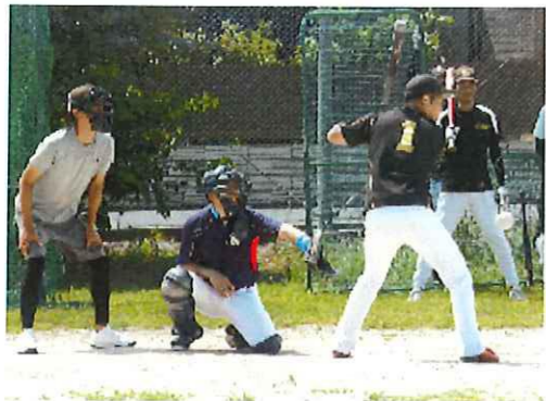
ソフトボールの部 福庭Aが「宿敵」本町破り優勝