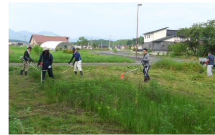
ぺっ! やしろ 桑田 鈴士

八月二日(日)、ぺっ! やしろで、社小学校前休耕田、プール横小川、社保育園の草刈りをした。新型コロナウイルスの影響により、ぺっ! やしろの今年最初の活動である。作業は小一時間程で終わったが、綺麗に刈られた現場を見るのは気分が良いし、地域の方のあゝ、やっとななるな〜と感じられる温かい目だった。声掛けだったり、作業後のちよっとした会話だったり、あまりにも久しぶり過ぎていつも以上にグッと来るものがあった。イベント自粛が続く昨今、ぺっ! やしろも何が出来るのか模索中だが、やってくるメンバーも楽しい、見ている方、参加された方も楽しい、そんな活動が出来たら良いなと思う。