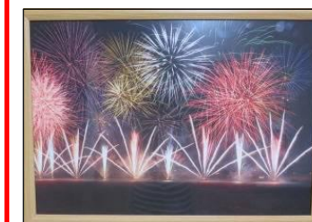
2018年島根県江津市の花火大会

お気に入りの写真があれば、花火の写真をハガキにしてプレゼントして下さるそうです。夏の便りを誰かに送ってはどうでしょう。ご希望の方は展示場所にある用紙に記入して公民館事務室（または玄関のポスト）にご提出ください。展示は8/31まで