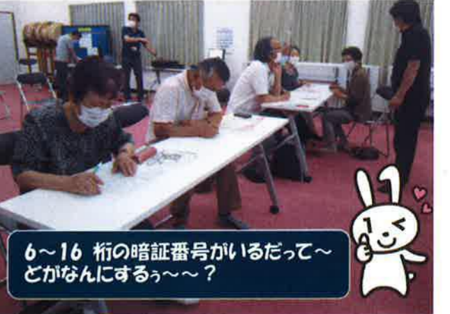
6～16桁の暗証番号がいるだって～どかなんにするっ～？

7月27日(月)、マイナンバー制度について説明を聞いた。日本に住民票がある人全員にマイナンバーがあり、ICチップ付きマイナンバーカードは申請が必要とのこと。各種証明書の発行がスムーズになり、身分証明書としてはもちろん、健康保険証として利用できるようになるそう。心配される安全性は高く、9月以降はキャッシュレス決済でマイナポイントがもらえるとのこと。 もちろん！マイナンバーカードがないことには始まらないので、早速希望者による申請の手続きを行い、会場は市役所の窓口のような賑わいとなった。