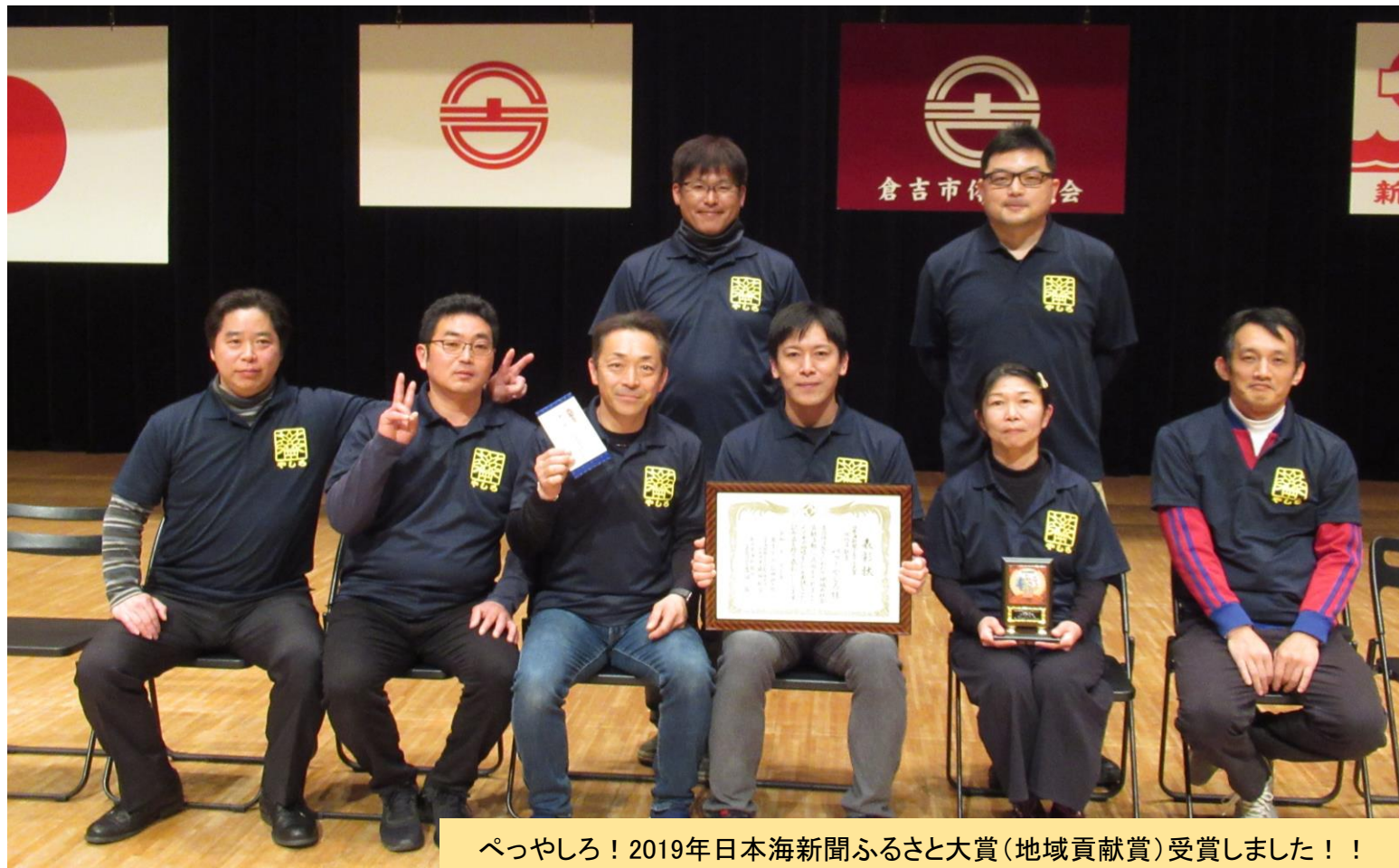
ぺっやしろ! 2019年日本海新聞ふるさと大賞(地域貢献賞)受賞しました!!