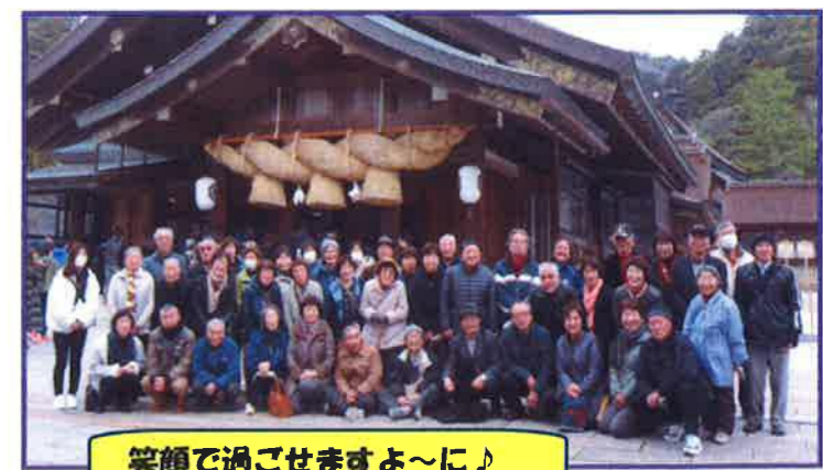
笑顔で過ごせますよ~に♪

2月23日(日)、お年寄りの引きこもりを防ぎ元気で楽しく生涯を送っていただくよう、出雲大社へお出かけしました。 バスの中の「車内サロン」ではクイズを楽しみ、「普段は一人で過ごすことが多く、いろいろな人と話ができ良かった。」と喜んでいただきました。 神楽殿でご祈禱していただき、健康を祈願してきました。ステキな1年になりますように♥