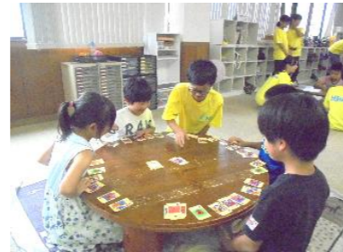
R1.8.19 それいけ!リーダーさん!!の様子

今年度、中学生KGLが小学生KGLをフォローしたり、アドバイスをしたりと、同じKGLでも違う立場で活動してもらいました。リーダーシップを発揮し、とても頼もしい姿を小学生KGLに見せてくれたことは、大人のスタッフにはできない大切な「関わり」だと、実感しました。