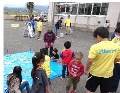
R1.11.3 ゲームやろうぜ!in上北条まつりの様子