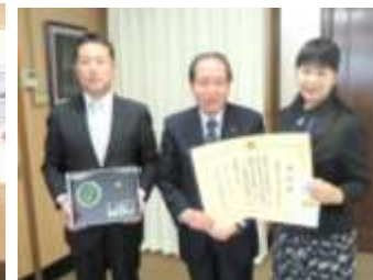
【倉吉市長、教育長への報告会の様子】