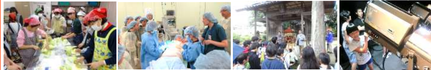
【焼きそば準備の様子】

この度、第72回優良公民館表彰（全国で75館）において、表彰館の中でも特に優れた活動を行ったとして、倉吉市上灘公民館が優秀館（全国で5館）に選ばれました！この表彰は、H28年度から行っている「うわなだ未来塾」の事業が評価されたものです。この事業は、地域の活性化に向けての人づくり・地域づくりが必要と考え、「地域に愛着と誇りを持った青少年の育成、次世代リーダーの育成、豊かな人間関係の醸成」を目的として始めた事業です。事業は、企画から運営まで一緒になって行ってくれる地域の有志メンバー『企画運営委員』と、小学校の先生方・地域住民の賛同者（ボランティア）の協力のもと開催することができました。「うわなだ未来塾」は、主に小（高学年）中学生を対象に、倉吉市役所、倉吉淀屋、フィギュアミュージアムや上灘地区内をめぐり上灘や倉吉の発見をする地域探検、倉吉未来中心、明治製作所、鳥取看護大学などをめぐる企業探検、うわなだ桜まつりでの中学生屋台コーナーを盛り上げるための桜まつり作戦会議などを開催しました。特に、6年生を対象とした地域探検「クイズラリーで上灘を探検しよう♪」では、県立厚生病院もさることながら、地域の方々の大きな協力を得ての開催は、子ども達だけでなく私たちにとっても意義深い事業となりました。また、この表彰は“地域の方々の協力があってこそ”の受賞だと思っており、小学校の先生方や地域の皆さんに感謝の気持ちで一杯です。“大人になっても上灘や倉吉を誇りに思える人になって欲しい”との思いから、「うわなだ未来塾・地域探検」は、日程や方法を協議し工夫しながら今後も続けていきたいと思っていますので、引き続き皆様のご協力と参画をよろしくお願いいたします♡