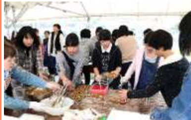
【桜まつり・中学生屋台の様子】