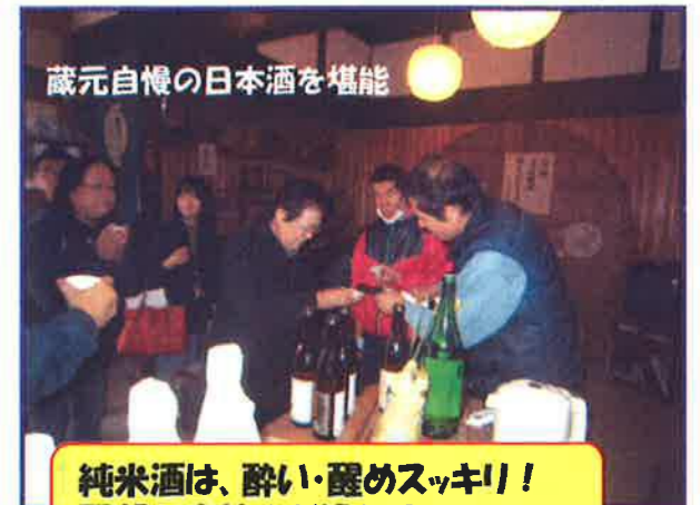
蔵元自慢の日本酒を堪能 純米酒は、酔い・醒めスッキリ！翌朝の爽快さが違うけ〜♪