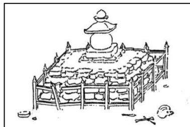
← 中世に描かれた積石塚と五輪塔