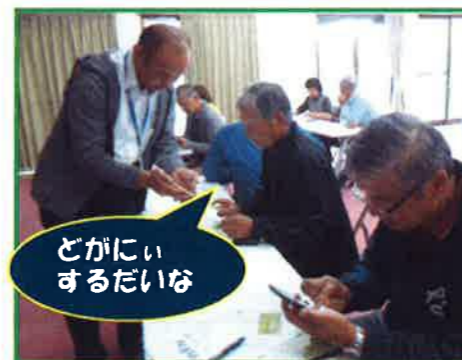
どがにいまするだいな