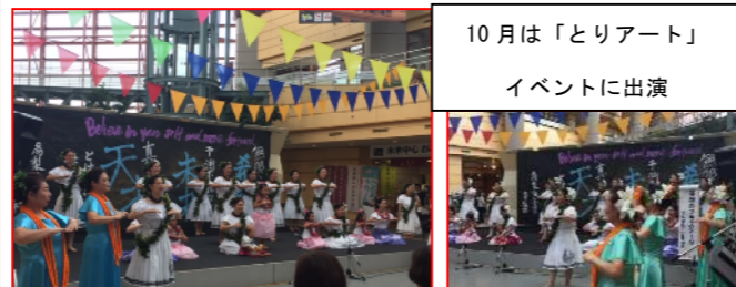
10月は「とりアート」イベントに出演

毎月第4月曜日は 子ども食堂テラハウス 11月25日(月) 会場 成徳公民館 第4月曜日 時間【17時～20時】 子ども100円 中高生200円 大人500円