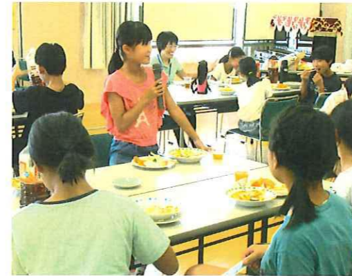
美味しいカレーライス 食べながら体験の発表

上井地区の児童たちは、グループに分かれ「メッセージカード」を作成。それは手作り感満載の心温まるカードばかりでした。その後、小学生2名と配送ボランティアの方と一緒に「手作りカード付お弁当」を届けました。新たな出会いは、笑顔と「ありがとう」に、溢れていました。(杉本 記)