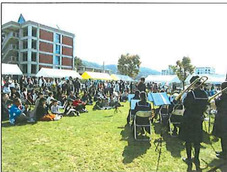
芝生広場で芸能発表聞く人たち(昨年の様子)

私の古里は、山あり海ありの恵まれた所で、そんな所で育ちました。そして、幼なじみ同級生の顔が良く思い浮かびます。 春は母の手作り弁当を持って、弟妹と一緒に「馬の山」の畑に上りました。大きな声で、「スワスワ」と言っておちそうを食べます。あの頃は何も無かった時代です。それが唯一の楽しみでした。 夏は海水浴で泳ぎに行き、大きな岩場の「兜島」で足から飛び込みをした青春の思い出。 秋はお祭り行事で賑わいました。 町のひとは、行列が