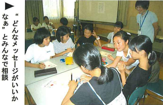
“どんなメッセージがいいかなあ”とみんなでお話

8月8日(木)連日の猛暑の中、河北小学校5・6年生22名(男子7名・女子14名)が「給食配送ボランティア体験」をしました。