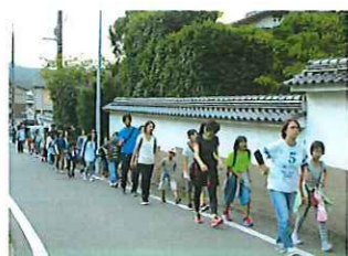
写真II JR線路沿いの道・金比羅院前を歩く。