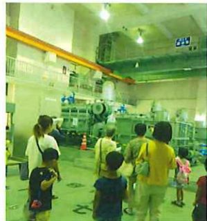
写真…倉吉市上井雨水排水ポンプ場

他にも「きれいにして自然に戻すのは大変だな」「水道からの水が海に流れるまでが勉強できて良かったです。」など身近な施設について学ぶことができました。