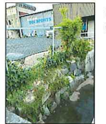
歴史の残る水路の石組

丸紅エネルギー特約店 真木自動車 河北給油所 倉吉市河北町160番地 TEL:0858-26-6411