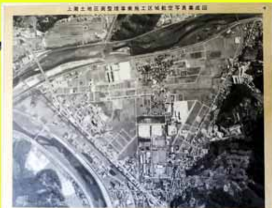
昭和50年10月撮影の上灘地区航空写真