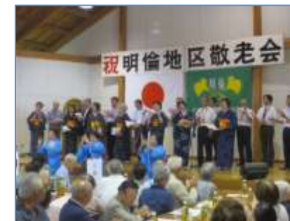
今年の明倫地区の敬老者(75歳以上)の方は885人です。 (男性291人・女性594人)