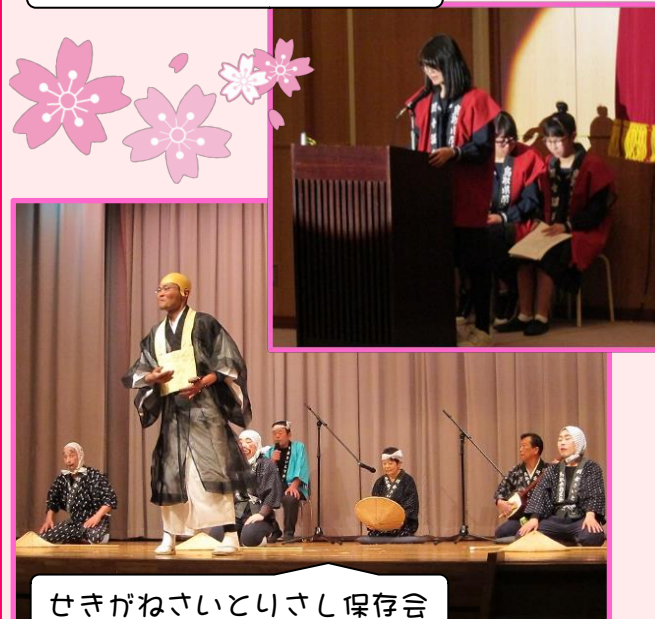
せきがねさいとりさし保存会

3月3日(日)、湯命館隣の関金都市交流センターにて「第14回せきがね芸能まつり」を開催しました。