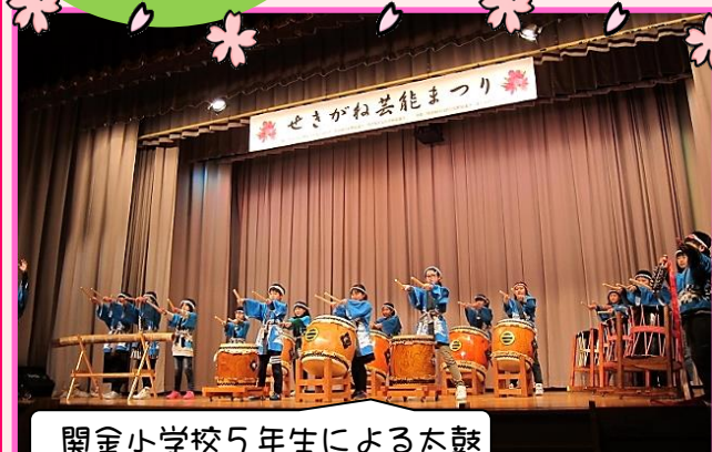
関金小学校5年生による太鼓