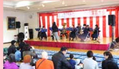
H30年『うわなだ桜まつり』より