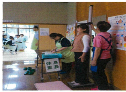
【まちの保健室】「ハ〜イ背伸びて」???

今年、9月25・26日の両日、7名の学生が実習にやってきました。初日は地域内調査と「なごもう会」への参加、二日目は情報収集と「まちの保健室」の運営を行いました。最初は緊張気味だった学生たちも、住民の皆様の親切な対応に触れ、徐々に緊張がほぐれ学びを深めていく姿がありました。なお、12月には「フィールド体験実習」として、人権フェスティバルや桜集落で学習を行いますので、地域の皆様のご協力をよろしくお願い申し上げます。「生活健康論実習」学内発表資料を公民館で展示中