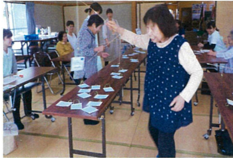
なごもう会での認知予防活動【タイ釣り】

開学4年目を迎えた鳥取看護大学の建学の精神は「地域の発展に貢献できる人材の育成」です。その教育活動の一環として実施されているのが地区公民館を拠点にした1年生の「生活健康論実習」で、地域に出向き、様々な知的刺激を受け、情報収集・処理能力や考察力、また情報伝達能力等の獲得を目指した学習の場になっており、毎年地域の皆様のご協力を得ています。