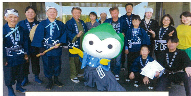
上演後山口県のキャラクター「ちよるる」と共に

山口県長門市の「山口県立劇場ルネッサながと」で開催された「中四国郷土芸能フェスタ in 山口」に参加しました。今年は大山開山1300年関連の催しを中心に、2施設の養護施設への慰問を含めて計5回の出演をさせていただき高城唯一の郷土芸能を県内外にアピールできる機会を得た事で、保存会員の士気も上がり、継承活動に向けて一層の努力をしていかなければと意を強くしました。