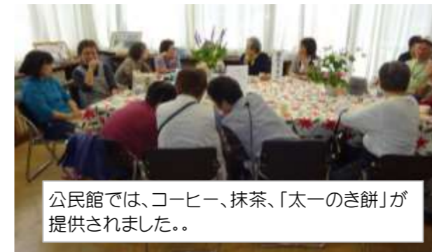
公民館では、コーヒー、抹茶、「太一のき餅」が提供されました。