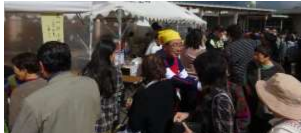
小鴨公民館「大人の子ども会」として参加しました。たくさんの方にお越しいただきありがとうございました。