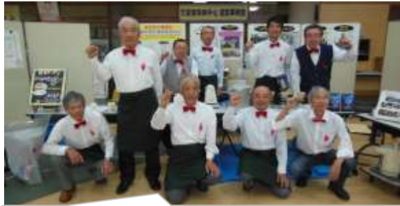
コーヒーの提供を通して「男のクラブ活動」と「小鴨のPR」をしてきました！