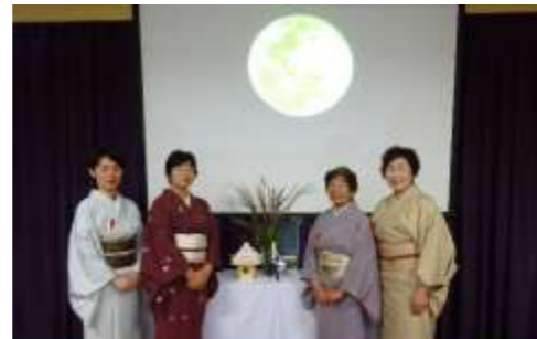
いつも美味しいお茶をありがとうございます。