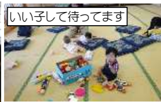
いい子して待ってます