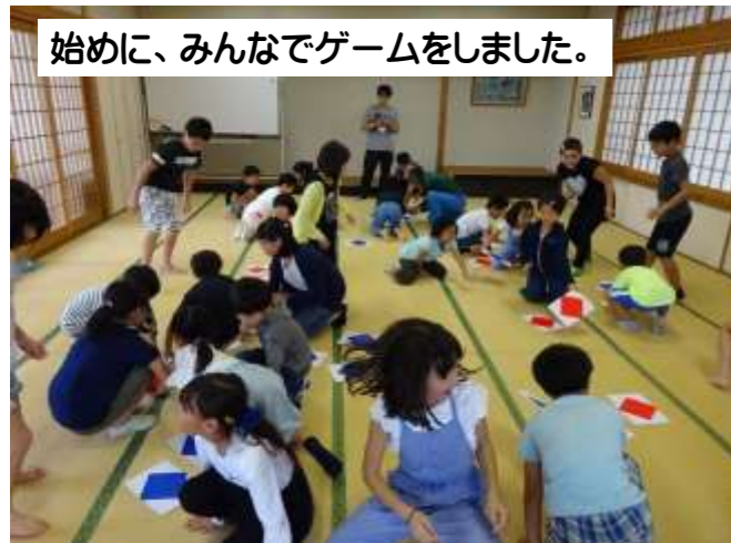
始めに、みんなでゲームをしました。