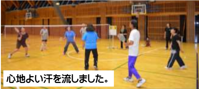
心地よい汗を流しました。