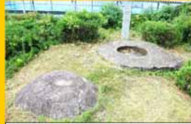
『大御堂廃寺塔心礎』