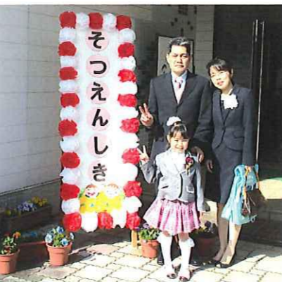
▲ 喜びいっぱい。ピースサイン 上井保育園の玄関前 3/24(土)

春に花の咲くのを促すという「催花雨」(さいかう)。長雨の上がった朝、河北小グランド裏の河川敷に行く▽昨秋、河北小の子供達が蒔いた菜の花の種。一緒に育つ雑草に「負けるな、冬の寒さに負けるな」と見守るだけだった。冬の寒さに耐えて、青々と広がる葉の中には太い蕾が立つ。黄色の花が春風に揺れるのも、もうすぐ!(大嶋)