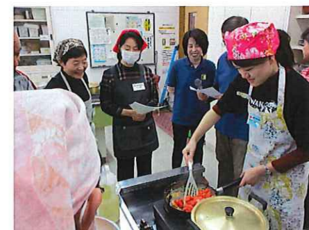
▲ 台湾の家庭料理にチャレンジ

ました。食後には台湾の歴史や文化の紹介や簡単な台湾語(中国語)を伝授してもらいました。