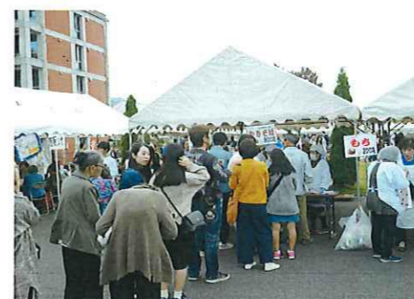
屋台に多くの人が並ぶ

今年は、「伊勢湾台風の爪痕」がパネル展示され、また、「倉吉市役所建設の記憶をたどる」のDVD映像が上映されました。