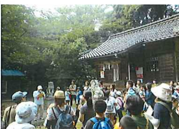
神社で説明を聞く

へ歴史を語り継ぐことの大切さ、子供たちの声や笑顔が地域の人を元気するのだと強く感じました。(てるよ)