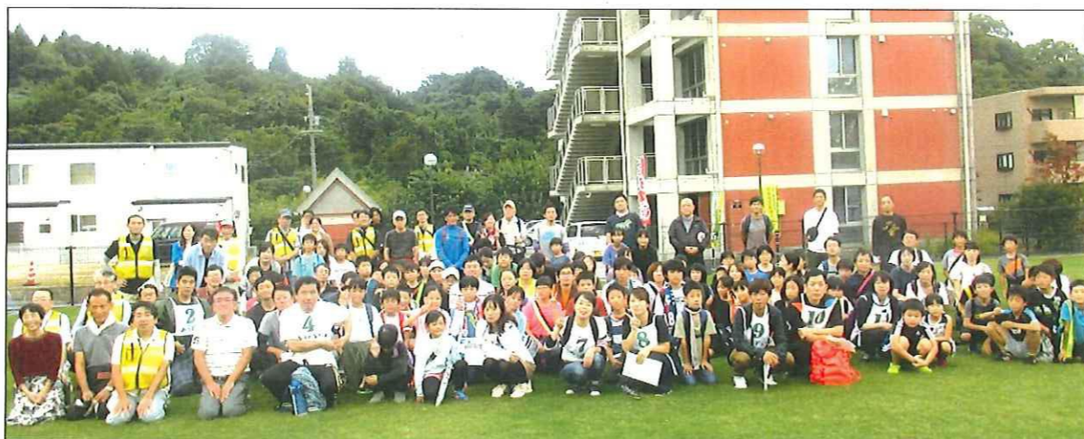
いっぱい参加者。壮観です。

9月28日(土)、「第17回あげいナイトハイク」が2年ぶりに開催されました。「河北小5年生親子会」と一般で約170名の参加。深まり行く秋の“ほしぞら”を楽しみました。