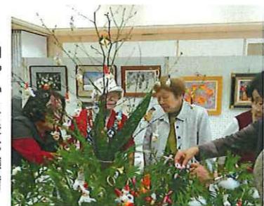
和やかに展示準備