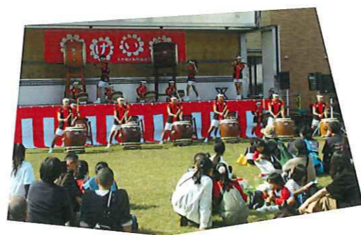
大勢の観客で賑わう広場