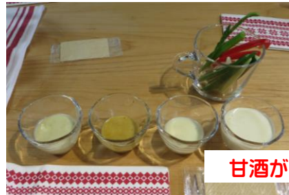
甘酒がドレッシングに变身!

住民が自分たちで企画、講座(教室)の流れを確かめ合い、やり遂げた事の達成感と、参加者から「自宅で後日、作ってみたよ!上手にできた!」の報告を聞くと、「甘酒づくり教室をやって良かった!」と教える側も参加側も成果を感じている様子が伺えた。