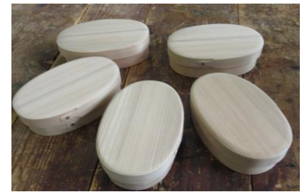
出来あがった曲げわっぱ