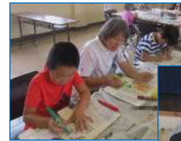
中央児童館の子どもたちとめいりん祭を彩る万灯を作りました。