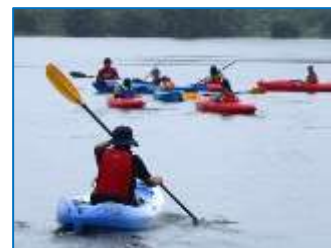
大山池でカヌーを体験しました。