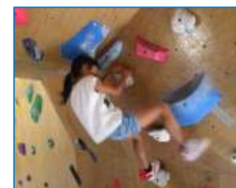
地区内にあるボルダリング施設「バーンズ」に行きボルダリング体験をしました。