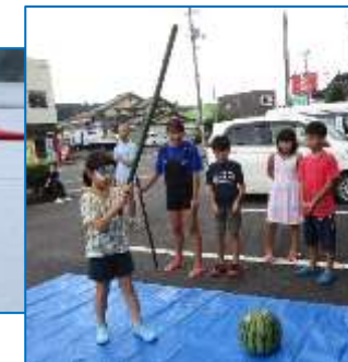
終わった後は恒例のスイカ割り大会!!