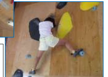
楽しかったです。ボルダリングが好きになりました。