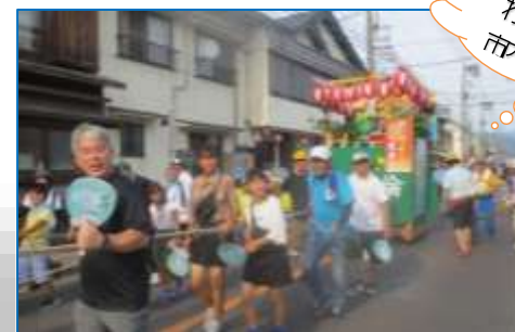
わいわいわいわい市が続けられました。