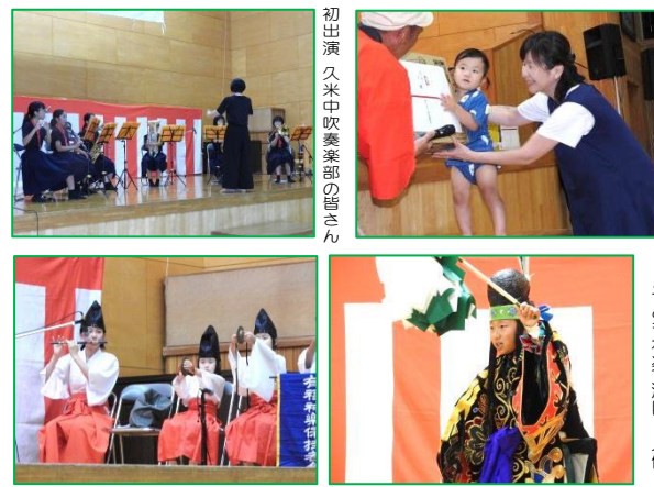
初出演久米吹奏楽部の囃子 有栖川保持協会 子代市神楽演目 人輪

今年度は悪天候のため急きよ会場を北谷小学校体育館に変更しました。慣れない会場での実施でしたが、実行委員会・出店団体の皆さんが一丸となり工夫を凝らした事で開催する事が出来ました。地域の皆様にも雨の中たくさんお越しいただき本当にありがとうございました。これからも地域で支え合い盛り上げていきましょう！ — 振興協議会 —