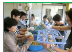
▲ 昨年の作業の様子

きみがら人形に使うトウモロコシの皮を準備する作業を8月に行う予定です。北谷の伝統的な民芸品作りのためご都合よろしい方がありましたら、お手伝いをお願いします。日程等詳しくは、防災無線でお知らせします。