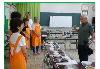
「えご」とは？ 日本海沿岸を主に、青森・新潟・能登半島で採取される「えごのり」を原料とした自然食品。