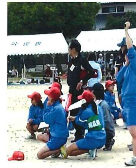
裏方で運動会を支える中学生たち