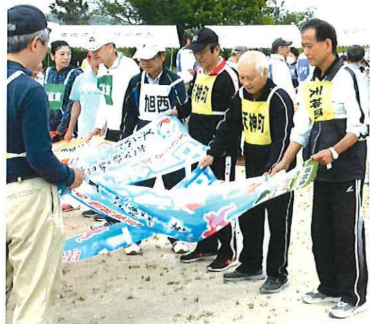
新競技 「あげいより愛をこめて」 旗の上のボールを渡しています

5月12日（日）、午前9時30分から「春の大運動会」が行われました。やや曇りの、ほど良い気温の爽やかな5月中旬の1日、地区からの17自治公が参加して、和やかな交流のイベントになりました。「やあ、久しぶり。何の競技に出るのだいな」等々、あちこちで話