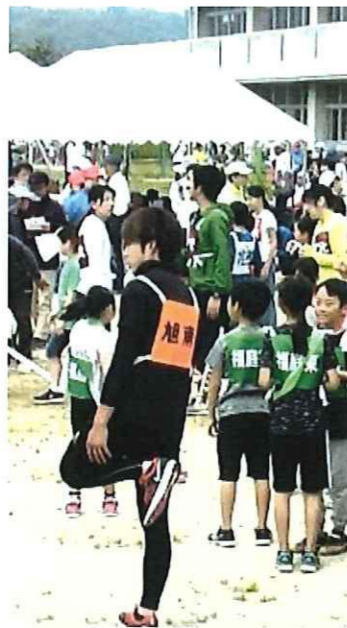
これから頑張るぞ！