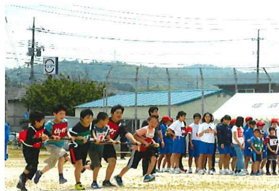
新競技 「ハリケーン」 6人で息を合わせてスタート！